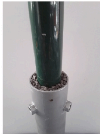
Piquet rond et gravier