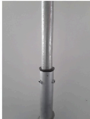
Tube 60mm avec cône