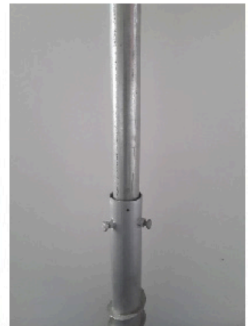
Serrage avec 3 boulons M12